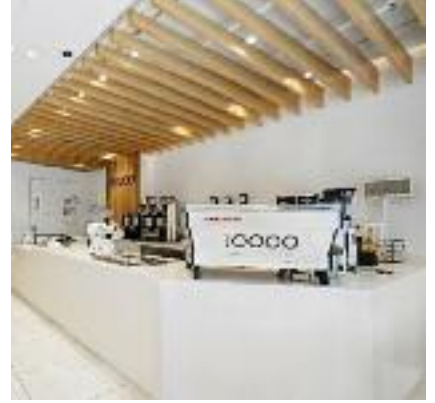
소비자 감성 자극 글로벌 스페셜티 커피 브랜드 'Ten Thousand'

그랜드 BK는 2022년 미국내 독점 라이선스 계약을 체결한 후 현재 뉴욕 타임스퀘어와 브로드웨이에 첫 매장을 성공적으로 오픈했으며 현재 뉴욕 맨해튼 내 3개의 매장을 운영하고 있다. 엄선된 고품질 원두를 사용하여 핸드드립 커피, 아인슈페너, 에스프레소 크림라떼와 같은 시그니처 메뉴를 제공하며 젊은 소비자층을 집중적으로 공략하고 있다.