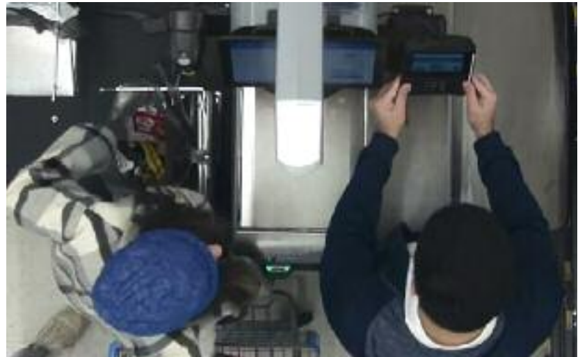
무인 판매대 매장에서 동료들이 가리고 있는 사이 신용카드 리더기 덮개를 뜯어내고 신용카드 스키머를 설치하고 있는 모습이 감시카메라에 포착됐다. 사진은 기소장에 포함되어 있다.