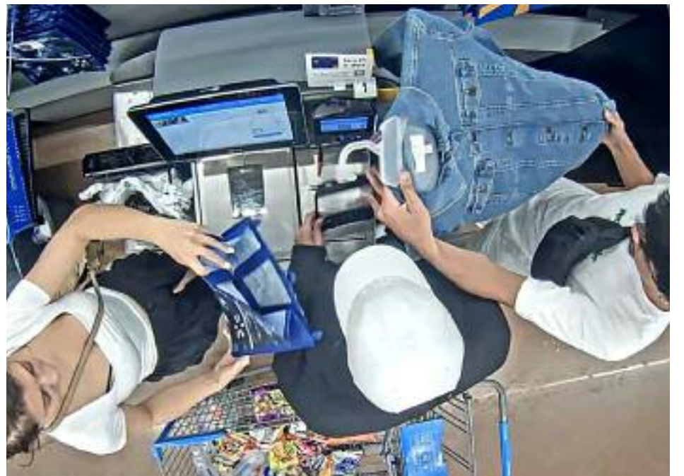
월마트에서 범인 일당이 크레딧 스키머를 설치하고 있는 모습. 두명의 공범은 골라 온 물건으로 작업을 진행중인 동료의 모습을 주위 에서 보이지 않게 가리고 있다.

이들은 로드아일랜드 존슨과 위익 그리고 매 사추세츠 시공크 비제이스 ▶▶12면으로 계속