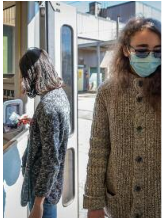
8월 1일부터는 크레딧카드, 스마트폰, 애플워치 등만 있으면 대중교통 요금을 간편하게 결제할 수 있다.