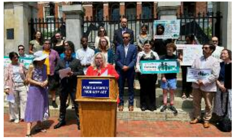
8일 주청사 앞 계단에서 열린 WFMA 1주년 기념 기자회견에서 콜린 오길비 매사추세츠 차량등록국장이 이 법안에 대해 설명하고 있다

서류미비자들에게 운전면허는 경찰의 단속에 걸린다는 두려움과 우려없이 운전과 병원, 식품구입, 직장 출퇴근 등 기본적인 생활을 영위할