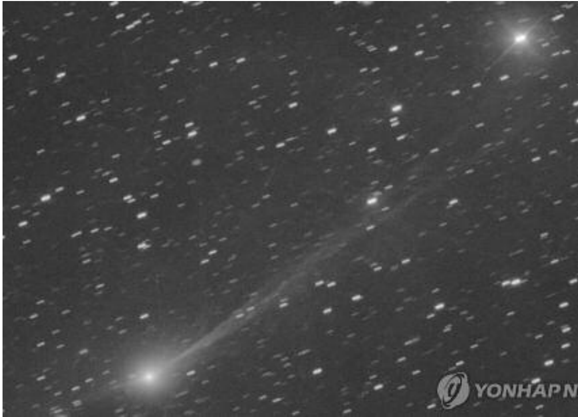
NASA가 공개한 성간 혜성 3I/ATLAS 촬영 이미지

태양계 지나는 외래 혜성 '3I/ATLAS' 관련 소문 일축 태양계보다 오래된 곳에서 기원했을 것으로 추정