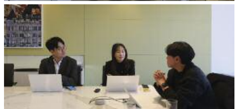
맨위: 한국 혁신 기업들과 1대 1 미팅을 가진 토드 다보크 퍼싱벤처스 벤처파트너, 한국 혁신 기업들의 미국 진출 가능성을 타진한 보스톤프론티어스2025 행사장, 모건루이스앤보키어스 로펌(두번째), 한국벤처캐피탈협회 관계자들(맨 아래)