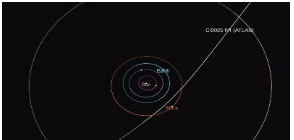
NASA가 공개한 성간 혜성 3I/ATLAS 이동 경로