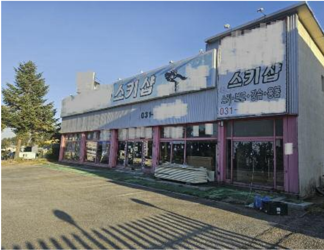
양지리조트 스키장 인근 문 닫힌 스키용품점

경기도 스키장 5곳 중 3곳 휴·폐장...일부 스키장도 '고민 중' 인공눈 의존 높아 비용 증가에 스키 인구 감소까지..."지원 필요"