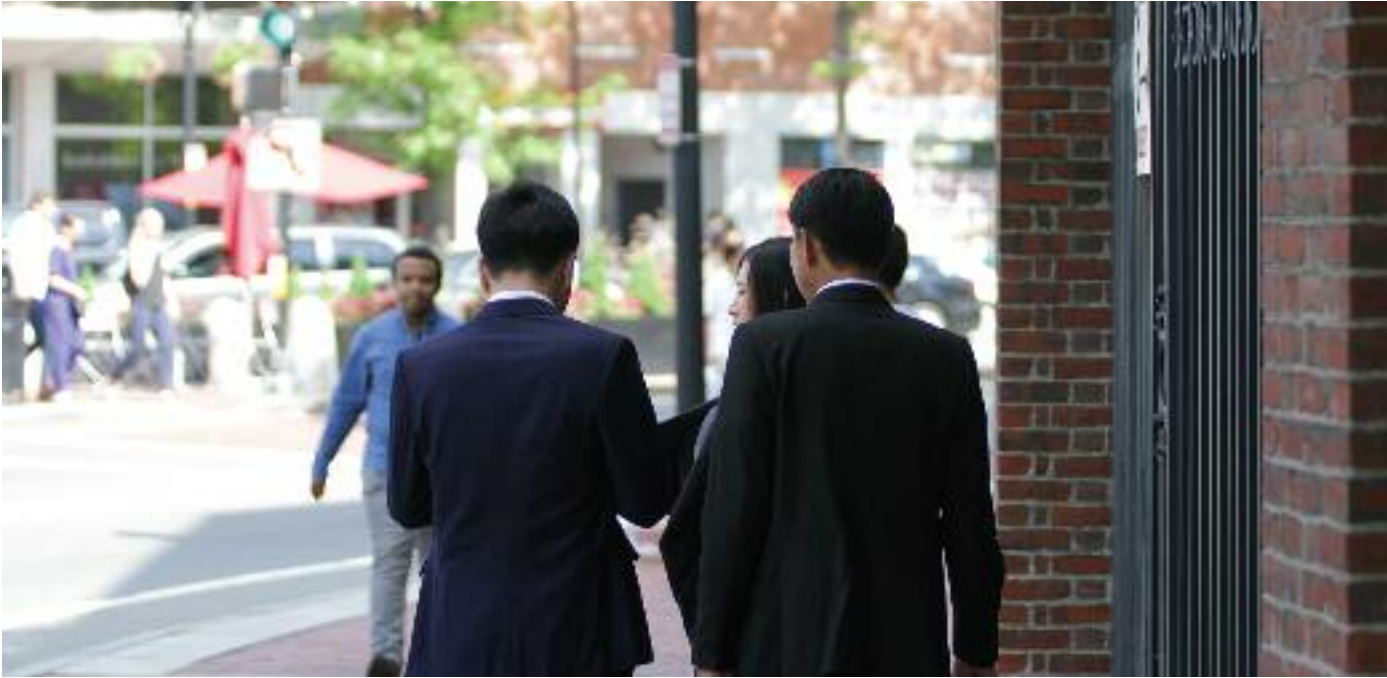
매사추세츠 주에 유학 중인 한국 학생들이 지난해 대폭 줄어 팬데믹이었던 2020년 보다 더 줄어든 것으로 나타났다. 미국내 전체 한국 학생들이 감소하기는 했지만 특히 매사추세츠의 경우 감소세가 컸다. 사진은 하버드 대학교