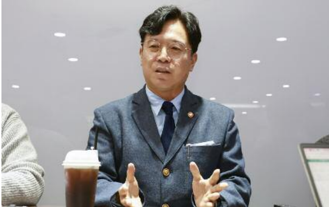
김영훈 고용노동부 장관

"최대한 노사 이견 조율해 합의 도출 지원이 정부 역할...정부안 계획은 없어" "산재 감축, 규모 있는 사업장은 변화 감지..."심야노동 새벽배송 서비스 공론화