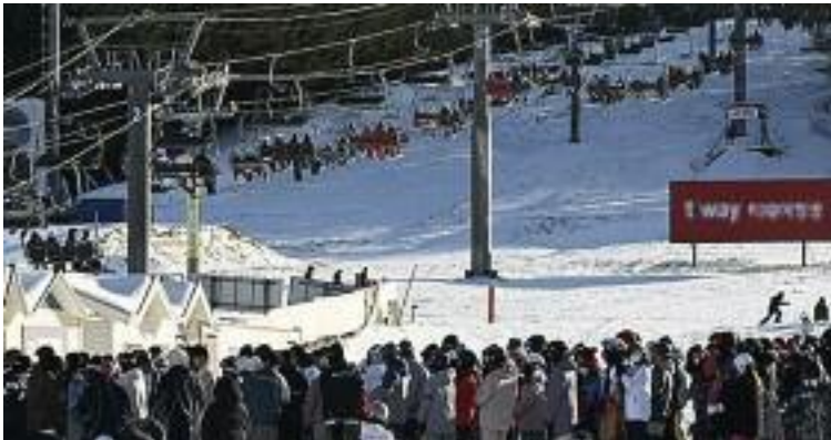
지난 29일 개장 후 첫 휴일을 맞은 강원 평창군 용평스키장.

키장 가운데서도 2~3곳이 경영 악화로 슬로프 축소 운영 또는 폐업 등을