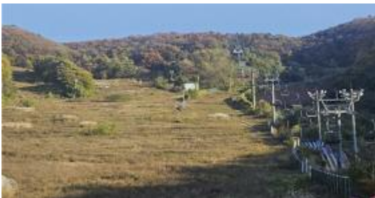
잡풀만 무성하자라고 있는 양지리조트 스키장