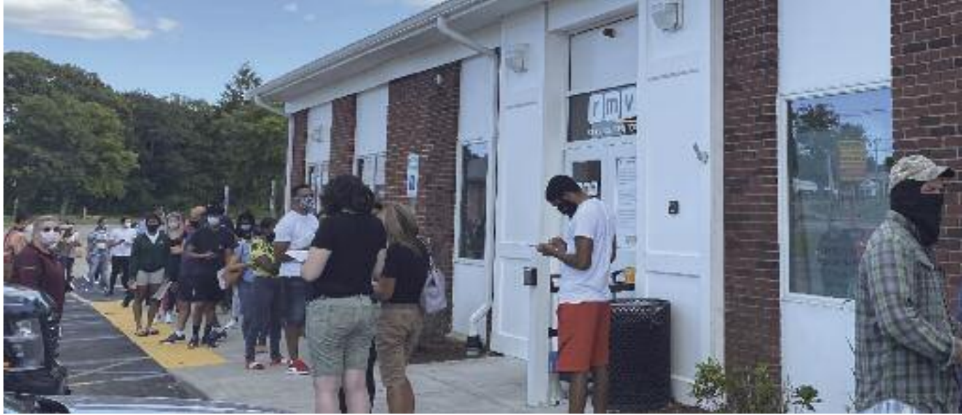
2020년 팬데믹 당시 RMV에 줄을 길게 늘어선 주민들의 모습. RMV는 예약을 미리 받았지만 줄이 끊이지 않았으며 일부는 차량에서 대기토록 했었다. 이민자들 신분과 관계 없이 운전면허증이 발급되기 시작하면 약 20여만명이 운전면허를 신청할 것으로 추정되고 있다.