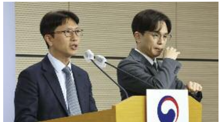
이규민 한국교육과정평가원장이 28일 오전 세종시 정부세종청사에서 2024학년도 대학수학능력시험 시행 기본계획을 발표하고 있다.

12대 원장인 이 원장을 포함해 역대 평가원장 중 3년 임기를 모두 채운 적은 1대, 4대, 7대, 10대 등 네 차례에 그친다.