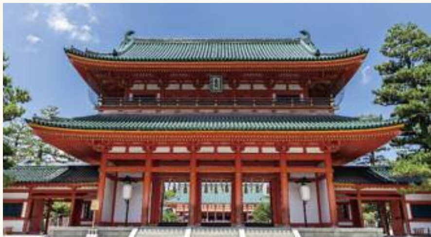
교토의 헤이안 신궁

칸무 천황의 생모는 고야신립 황태후로 백제사람이었다. 칸무의 아버지 코닌 천황의 어머니도 백제 도래인의 딸 다카노니 하가사였다. 그녀는 서기 785년 가와치의 가타노에서 제천의식을 행하였으며 서기 794년 헤이안경으로 천도해서는 하라노 신사를 짓고 백제왕들에게 제사를 지낸다. 칸무 천황 여인들 중에 백제 의자왕의 아들 부여선광(夫餘善廣)의 후손이 있어 백제 왕씨를 후궁으로 맞아 들인다. 칸무는 자신의 후궁에 9명 이상의 백제 여인들이 있었다. 속일본기에서 그는 항상 말하기를 백제 왕씨는 그의 외척이라고 말하며 그들을 우대하였다. 그 때문에 일본 조야에서는 백제계와 한방울의 피라도