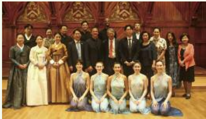
음악회 후 연주자 및 행사진행 및 주최측 관계자들이 함께 했다