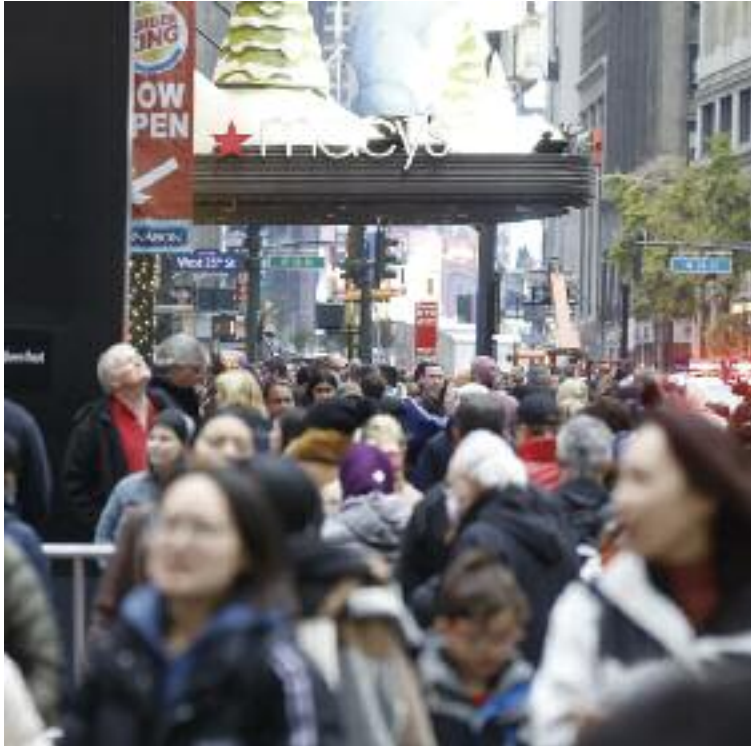
미국의 한 쇼핑물

민주당과 공화당을 대표하는 양대 후보가 맞붙을 내년 대통령 선거를 앞두고 그 격차는 점점 더 선명하게 부각될 것으로 예상된다.