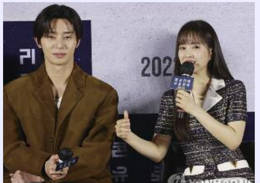
배우 박보영(오른쪽)과 박서준이 21일 서울 광진구 롯데시네마 건대입구에서 열린 영화 '콘크리트 유토피아' 제작보고회에서 질문에 답하고 있다.

이어서 꼭 작업해보고 싶었다"면서 "저에게 제안이 온 상황이 아니었는데, 먼저 제가 감독님에게 출연하고 싶은 마음을 강하게 어필했다"며 웃었다. 그는 재난 이후 가족을 지키는 것이 단 하나의 목표가 된 민성을 연기했다.