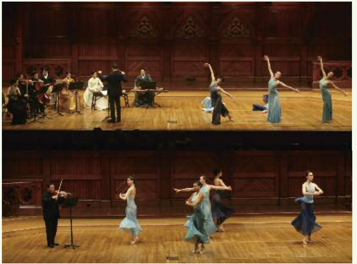
한미동맹 70주년 기념 음악회에서 연주와 발레단의 발레

그뒤 연주된 라벨의 소나타는 현대적인 사운드와 불협화음, 여유로움과 긴장감의 대비, 현을 활로 긋는 것과 손가락으로 튕기는 연주 기법의 교차 등을 보여준 어려운 곡이었는데, 바이올린(제이 코스모스리 연주)과 첼로(자크 우즈 연주)는 놀라운 집중력과 음악성으로 완성도 높은 앙상블을 보여주었다.