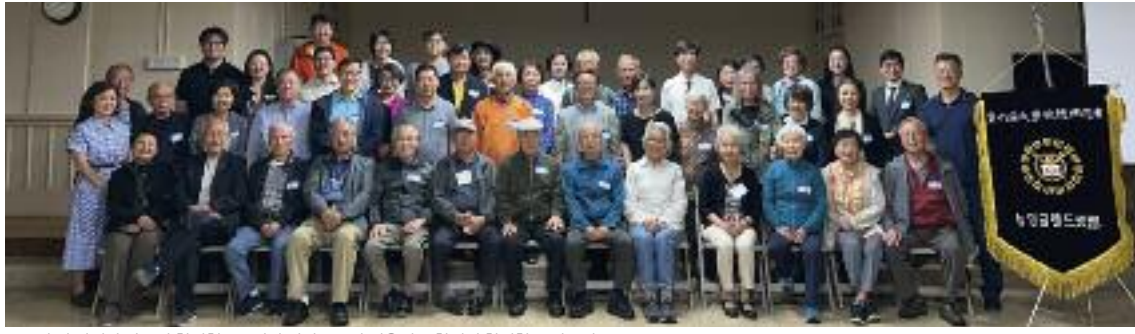
튜턴의 성 앙투앙 다블뤼 한인천주교에서 열린 2023년 서울대 동창회에 참석한 뉴잉글랜드 동문들