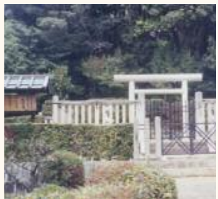
화신립 태후의 릉

섞인 여인을 찾아 내는 것이 출세의 지름길이 되었다. 그래서 외국에서는 엉터리 가짜 족보나 계보가 유행하게 되는 것을 엄격하게 통제하게 되었다.