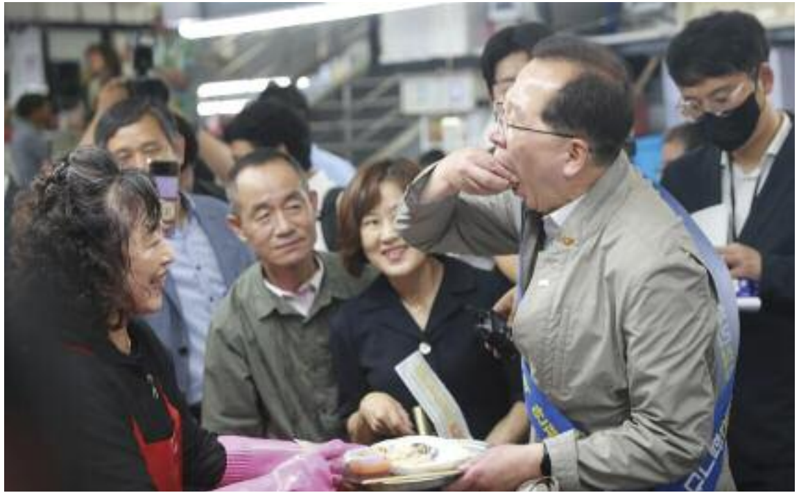
조승환 해양수산부 장관이 22일 오후 부산 중구 자갈치시장을 찾아 상인들을 만나고 수산물을 시식하고 있다.

조 장관은 "조업지에서 시료를 먼저 채취해와서 검사하든지, 선박이 밤에 산지시장으로 들어오면 새벽에 위판되기 전에 검사를 완료하는 등의 방식으로 검사를 마친 후에 유통되도록 하겠다"면서 "지자체에서 요구하는 예산이나 장비에 대해서도 적극적으로 확충되도록 하겠다"고 설명했다. ready@yna.co.kr