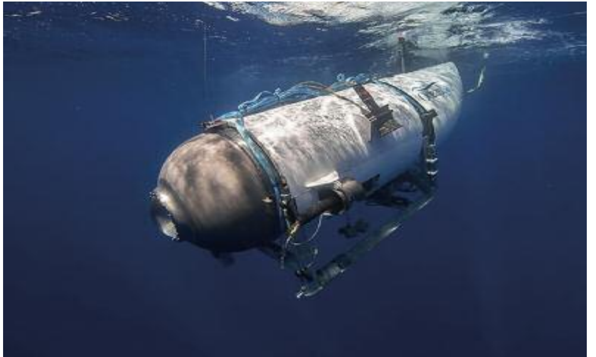
18일 실종된 잠수정 타이탄

잠수정에는 세탁기 문에 달린 창문과 같은 크기의 선장이 하나밖에 없었고, 리스는 당시 이 창을 통해 타이타닉 선체를 구경할 수 있었다고 전했다.