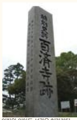
의자왕 의 아들 선광은 하라가타에 살았다. 쇼무천황이 후손 경복에게 백제왕 신사를 건립