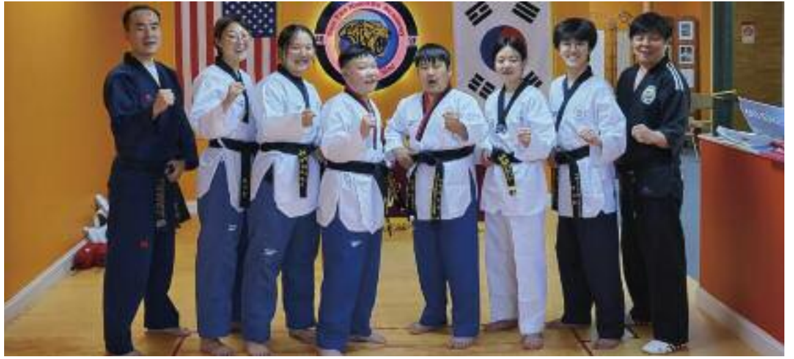
17일 덴버 소재 선태권도 아카데미에서 출정식을 가진 재미대한 태권도 협회