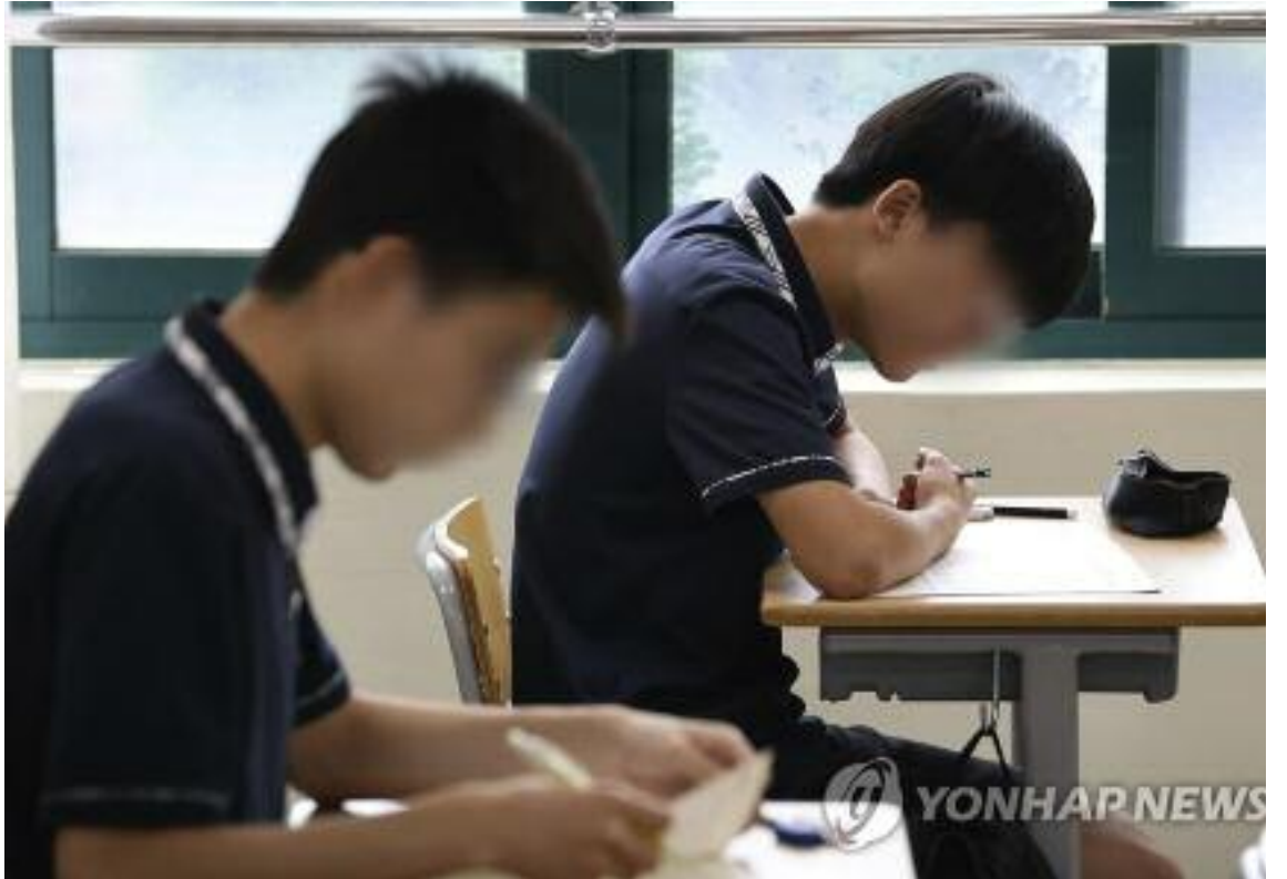
2024학년도 대학수학능력시험 6월 모의평가가 치러진 1일 서울 용산구 용산고등학교에서 한 3학년 학생이 마스크를 벗은 채 시험을 준비하고 있다.

경기 지역의 한 고등학교 교사는 "오늘 발표 뒤 교무실에서 이야기를 하느라 한동안 술렁였다"며 "킬러문항을 없애면 과연 수능의 변별력을 가질 수 있을지 회의적인 교사가 많았다"고 전했다.