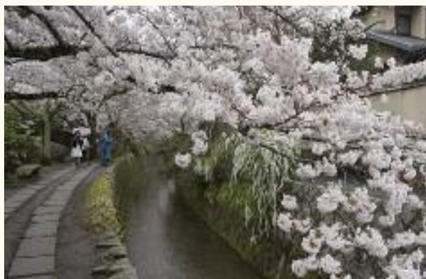
벚꽃이 아름다운 하라노 신사