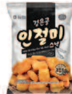
NONGHYUP Puffed Black Bean Rice Cake Snack 농협 검은콩 인절미 스낵 4.4 OZ