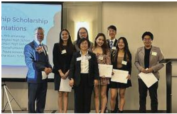
작년 정치인턴 장학생 모집에는 총 16명이 신청했으며 이중 6명이 정치인턴으로 선발됐다