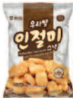
NONGHYUP Puffed Rice Cake Snack 농협 우리쌀 인절미 스낵 4.4 OZ