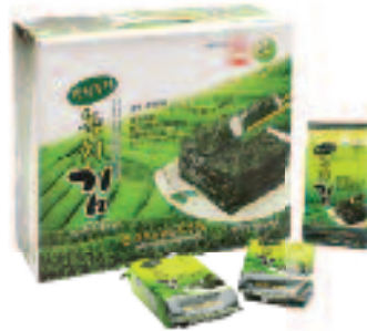
KWANGCHEON NONGHYUP Roasted Seaweed with Green Tea 광천농협 녹차 도시락김 0.14 OZ X 24 EA/BOX