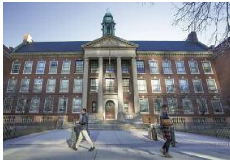
보스톤 라틴은 유에스뉴스가 선정한 2024년 고교순위에서 매사추세츠 1위, 전국 27위에 선정됐다