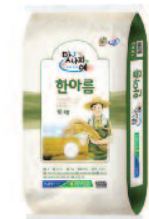
NONGHYUP Korean White Rice 농협 한아름 쌀 22 LB

Made with carefully selected ingredients that captures the fresh & authentic taste of Korea.