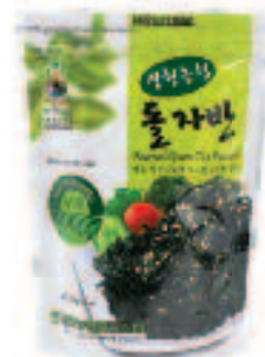
KWANGCHEON NONGHYUP Roasted Green Tea Seaweed 광천농협 돌자반 1.76 OZ