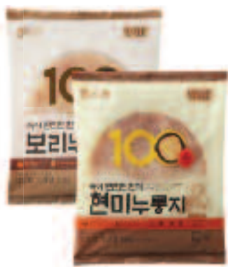
NONGHYUP Scorched Rice 농협 보리누룻지/현미누룻지 BARLEY/BROWN RICE - 5.29 OZ