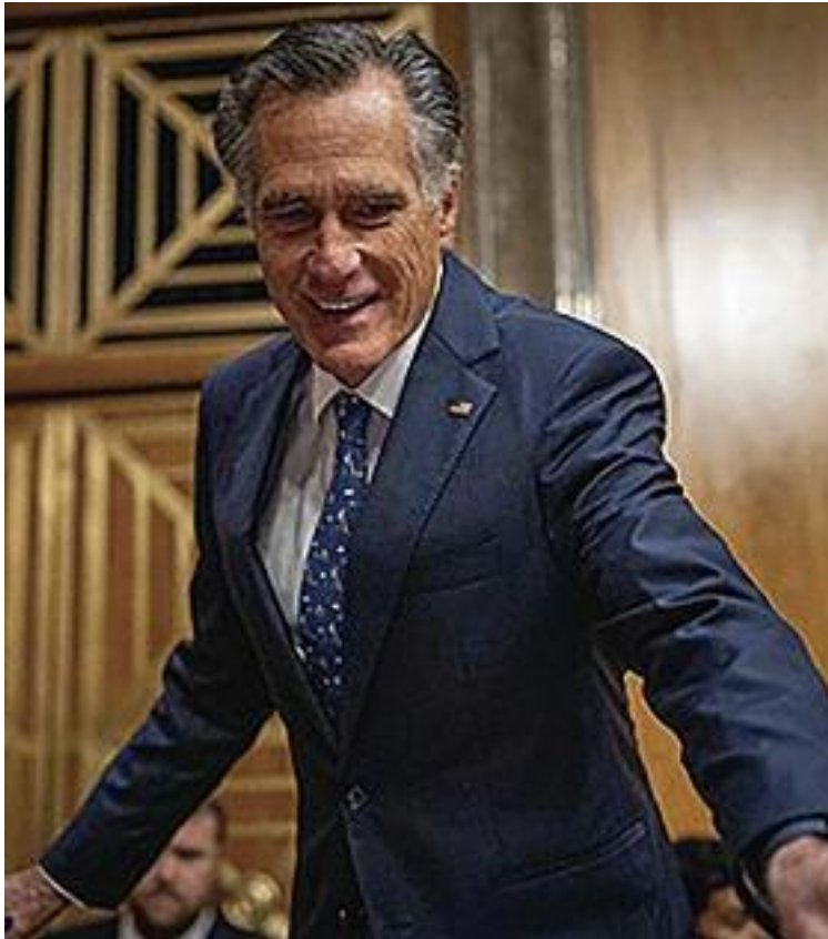
MIT 롬니 미 공화당 소속 연방 상원 의원

지난해 가자 전쟁 이후 반유대주의 논란에 휩싸인 하버드대는 올해 1월 그 여파로 클로딘 게이 전 총장이