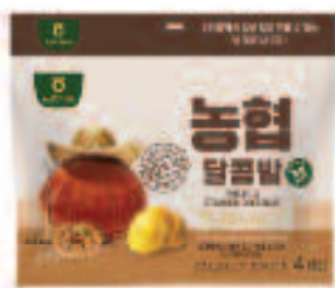
NONGHYUP Peeled & Steamed Chestnut 농협 달콤밤 1.83 OZ X 4 EA/PKG