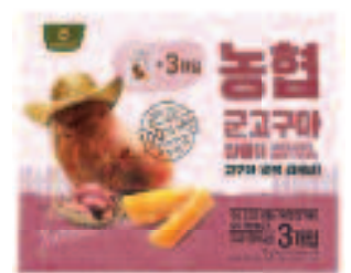
NONGHYUP Baked & Dried Sweet Potato 농협 군고구마 말랭이 1.76 OZ X 3 EA/PKG