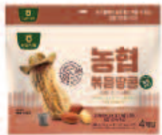
NONGHYUP Roasted Peanut 농협 볶음땅콩 2.47 OZ X 4 EA/PKG