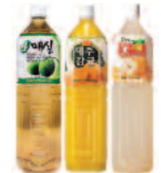
NONGHYUP Fruit Drink 농협 생매실/제주감귤/배 주스 PLUM/JEJU MANDARIN/PEAR - 1.5 L