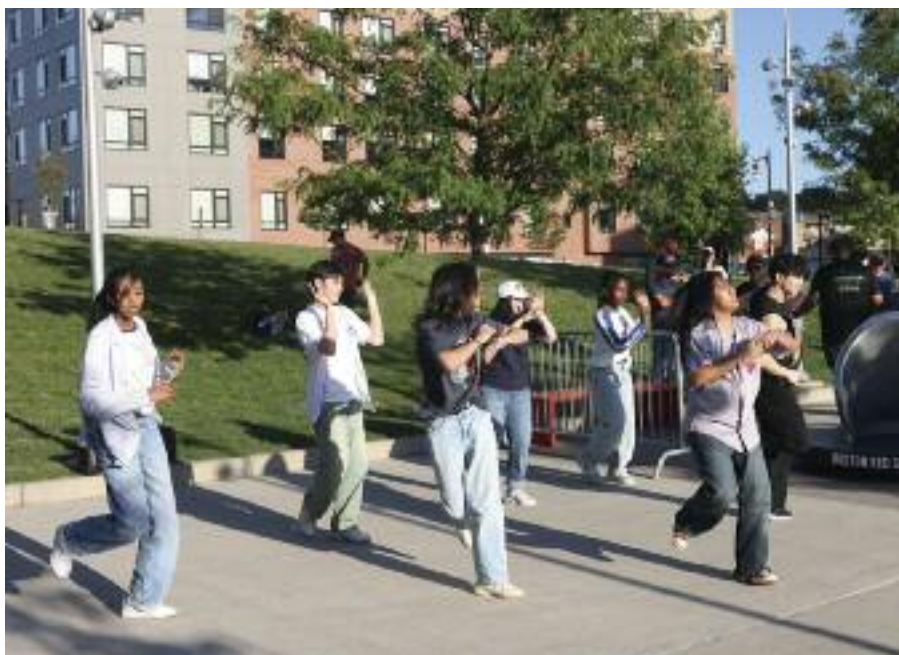
케이팝 댄스그룹 엄브라가 플라파크 메인게이트 앞에서 댄스를 선보이고 있다