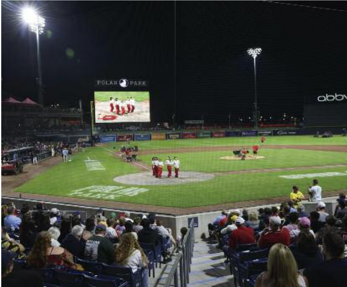
지난 22일 우스터 폴라파크에서 개최된 코리안 헤리티지 나이트에서 케이팝 커버댄스 팀인 허시(Hush)가 경기 후 홈 베이스 위에서 댄스를 선보이고 있다

올해 3회째 코리안헤리티지 나이트 케이팝 인기 확인 우스터 시는 태극기 게양, 조시 파티 시장 선언문 낭독