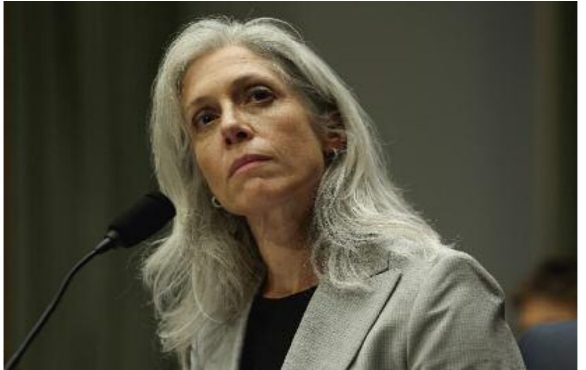
사임한 모나레즈 질병통제센터 국장