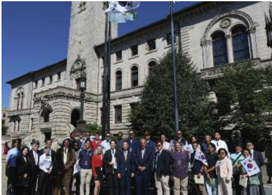
22일 우스터 시청 앞에서 태극기 게양 기념을 마치고 보스턴총영사관 김재휘 총영사 및 관계자들과 한인들 그리고 우스터 시청 관계자들이 함께 촬영했다