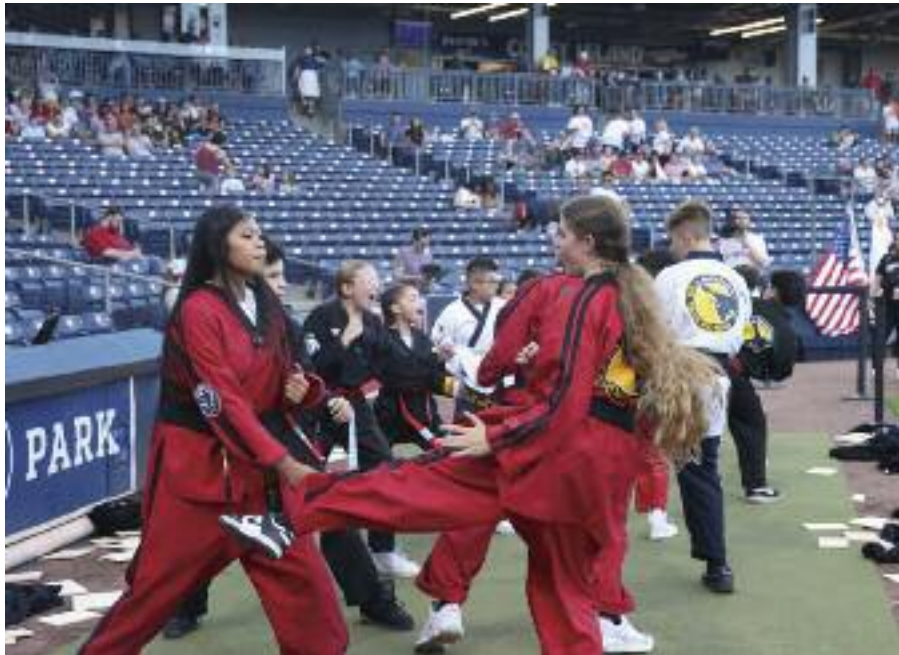
태권도 시범단의 시범