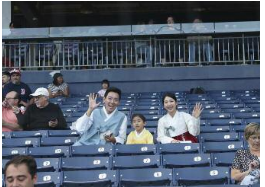
한복을 차려입은 한인 가족이 관중석에서 인사하고 있다