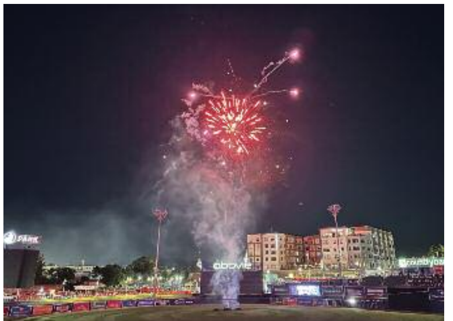
케이팝 음악에 맞춰 진행된 불꽃놀이