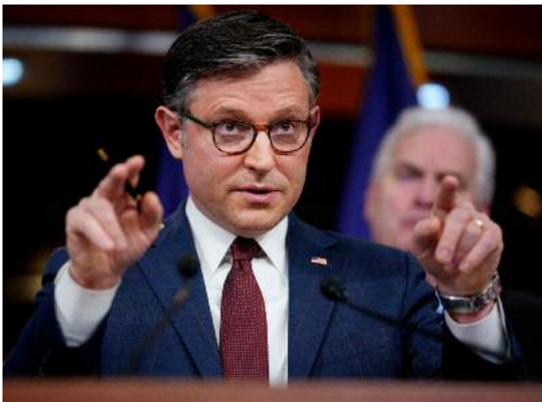
마이크 존슨 하원의장(공화당)

하원 내 11개 위원회가 각자 담당 예산 삭감안을 통합해 약 1조 5000억 달러의 재정 절감을 목표로 하고 있으며, 이 중 에너지·상무 위원회가 맡은 8800억 달러의 절감안이 핵심이다. 이 중 약 7150억 달러는 의료 관련 삭감에서 충당된다.