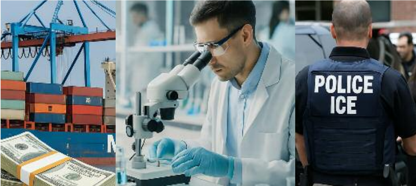
트럼프 정부가 추진중인 3대 정책이 매사추세츠 경제에 커다란 그림자를 드리우고 있다. BU 경영대학원 마스터 강사의 보고서에 따르면 매사추세츠는 관세, 바이오산업 보조금 축소, 이민 정책등이 지속되는 경우 내년 심각한 침체를 겪게 될 것으로 예상했다