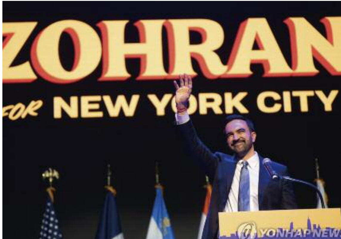
미국 뉴욕시장으로 당선된 인도계 민주 사회주의자 조란 맘다니

강세지 승리에 의미 국한... "내년 중간선거 선전은 미지수" 민심향배는 확실... 민생고·애국자·반기득권 등 선거 키워드 관측