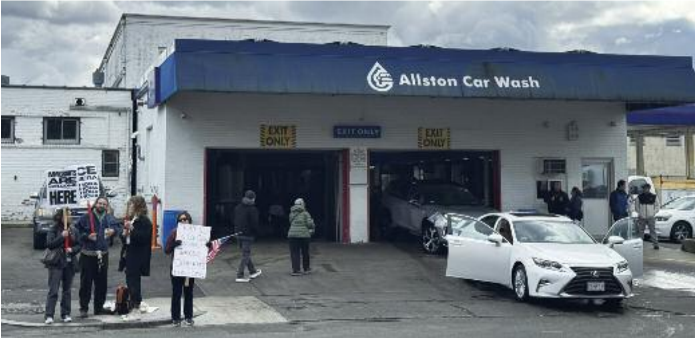
4일 미이민세관단속국(ICE)의 이민단속으로 9명의 직원이 체포된 올스턴 세차장. 6일 오전 현재는 영업중이지만 팻말을 들고 시위하는 활동가들의 모습에서 지난 이민단속의 여진을 느낄 수 있다. 단속에 대한 공포가 지역사회 내로 스며들고 있다