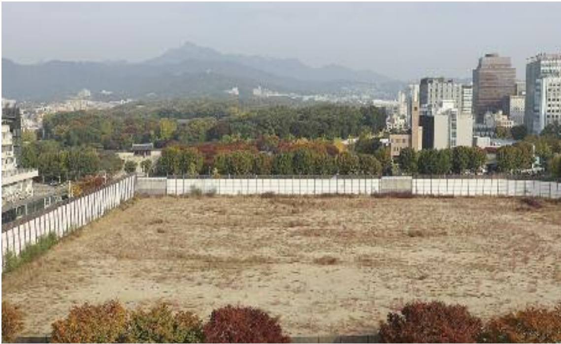
국가유산청(옛 문화재청)과 협의 없이 역사문화환경 보존지역 바깥에서의 개발 규제를 완화한 서울시 조례 개정이 유효하다는 대법원 판결이 나왔다. 이번 소송은 최근 '왕릉뷰 아파트' 재현 우려가 나온 서울 종묘 맞은편 세운4구역 재개발 사업과 관련해 주목받았다. 사진은 6일 서울 종로구 세운4구역 모습.

서울시의회 '보존지역 밖도 문화재 영향 검토' 조항 삭제 문체부 '국가유산청 협의 거쳐야' 무효소송 냈으나 패소