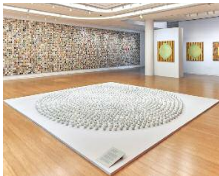
뉴욕한국문화원 강익중 회고전 (We are Connected) 전시장 모습