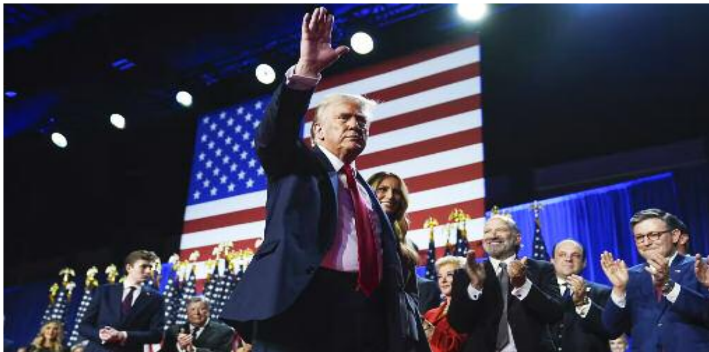
11월 5일 자정 승리를 선언하고 당선 피티장을 떠나는 도널드 트럼프 대통령 당선자. 20년만에 전체 국민투표 승리까지 이끌어내는 대승을 거뒀다