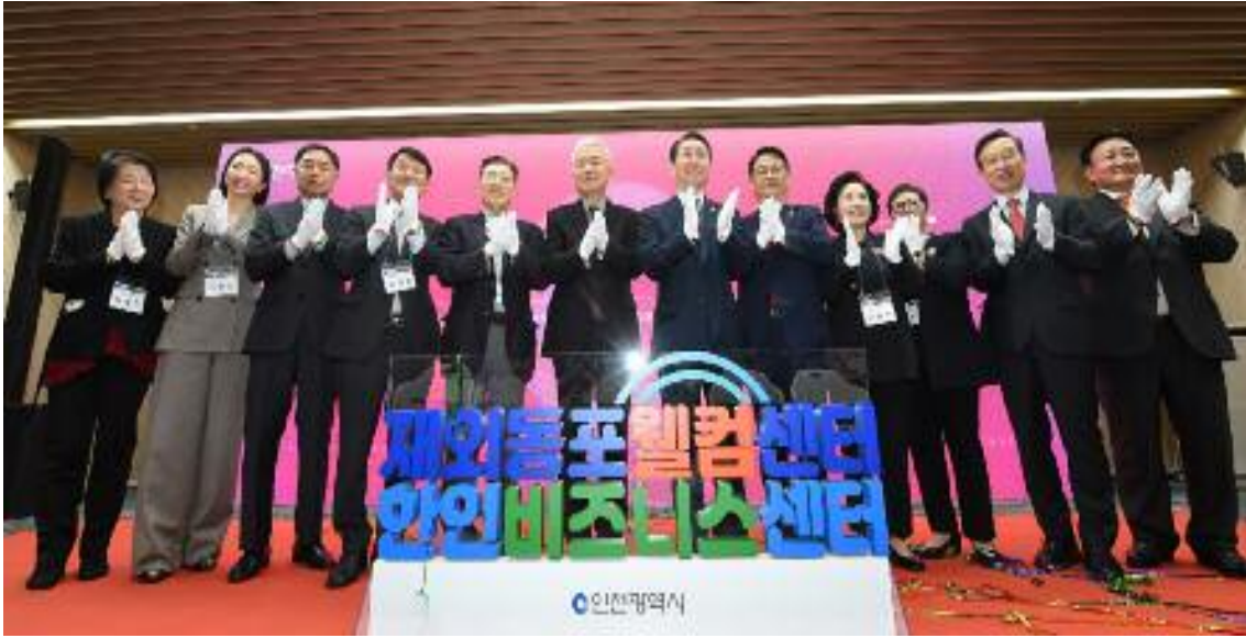
유정복 인천광역시장이 18일 부영송도타워에서 열린 재외동포웰컴센터·한인비즈니스센터 개소식에서 이상덕 재외동포청장 등 참석자들과 현판제막식을 하고 있다.