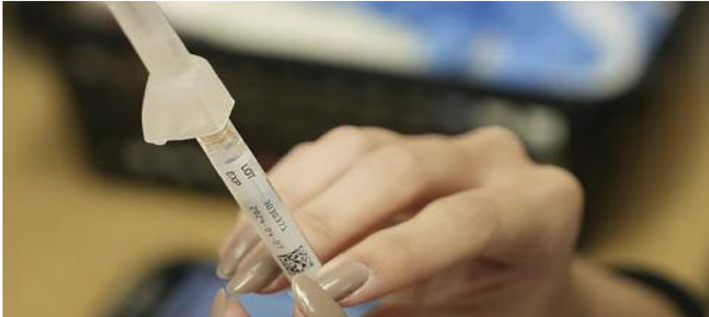
최근들어 매사추세츠내 코로나가 본격적으로 창궐하면서 확진자 수가 늘고 있다. 피하는 방법은 마스크와 백신이라고 전문가들은 이구동성 강조했다. 사진은 코로나바이러스 백신