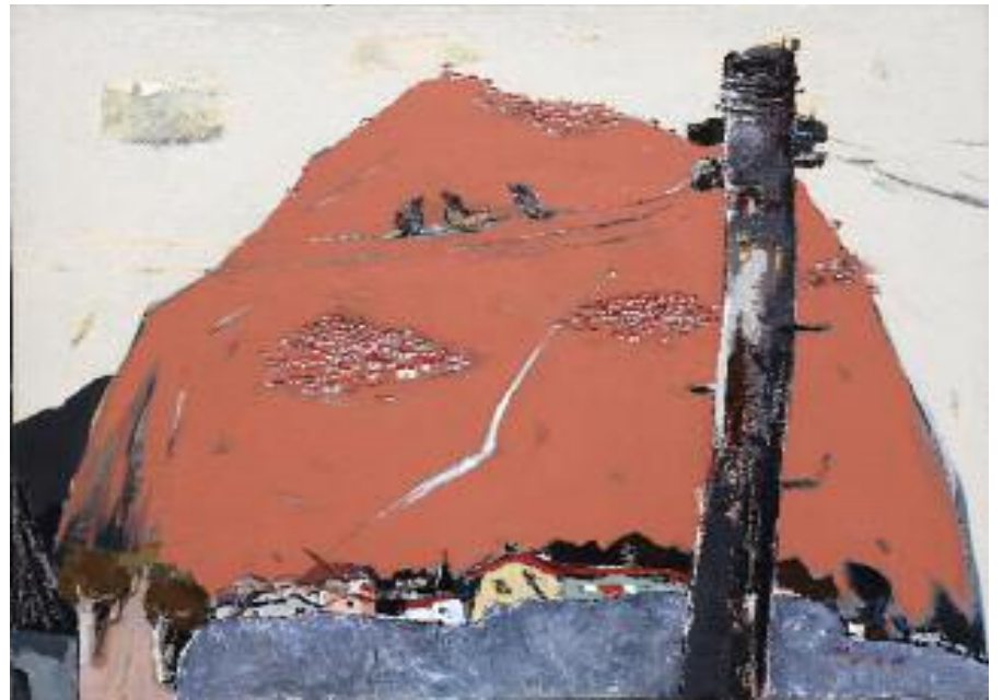
유수례 작 - 달동네의새

의 세계로 우리를 초대한다. 풍부하고 촘촘한 물감의 적용은 침묵 안의 평온함이 담겨 있으며 추상적인 요소의 질감에 초점을 맞추기 시작한다. 따뜻한 노란색과 카드뮴의 사용은 이 새로운 작품에서 가장 빛을 발한다.