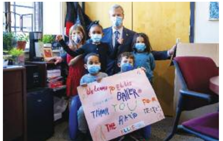
19일 주지사가 보스톤 소재 엘리스 조기교육센터를 방문해 속성 가정테스트 배포에 대해 설명하고 학생들과 함께 포즈를 취했다

반면 교사노조, 일부 방역전문가, 그리고 일부 학부모들은 고위험군의 가족들을 보호하기 위해 코로나 바이러스 유행이 한창인 지금 더 방역에 큰 노력을 기울여야 한다고 주장하고 있다. 이들은 코로나바이러스가 장기적으로 어떤 영향을 미칠