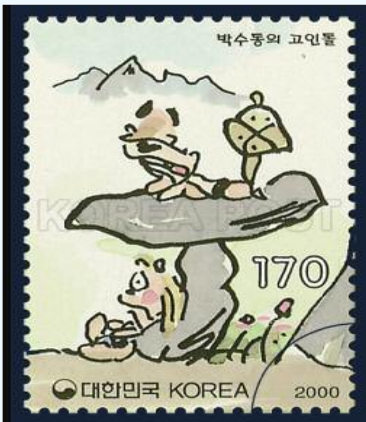
이 칼럼은 본지의 편집방향과 다를 수 있습니다

요즘처럼 팬데믹으로 사회활동이 제약을 받고 바깥 활동이 적으니 움츠러들고 외로움으로 우울해지는 이들이 많아지고 있지 않은가. 보고 싶은 가족들과의 나눔이 줄어들고 소원해지는 느낌에 서운함이 엄습하는 가족들 간의 틈이 생기는 것이다. 이럴 때 그 누구보다도 밝은 성격의 가족이 있다면, 이 어려운 시기에 밝은 에너지를 나눌 수 있으면 좋겠다. 가족들에게 전 화라도 걸어 안부를 물을 수 있다면, 그 외로움이나 우울함 그리고 불안과 초조가 조금은 나아지지 않을까 싶다.