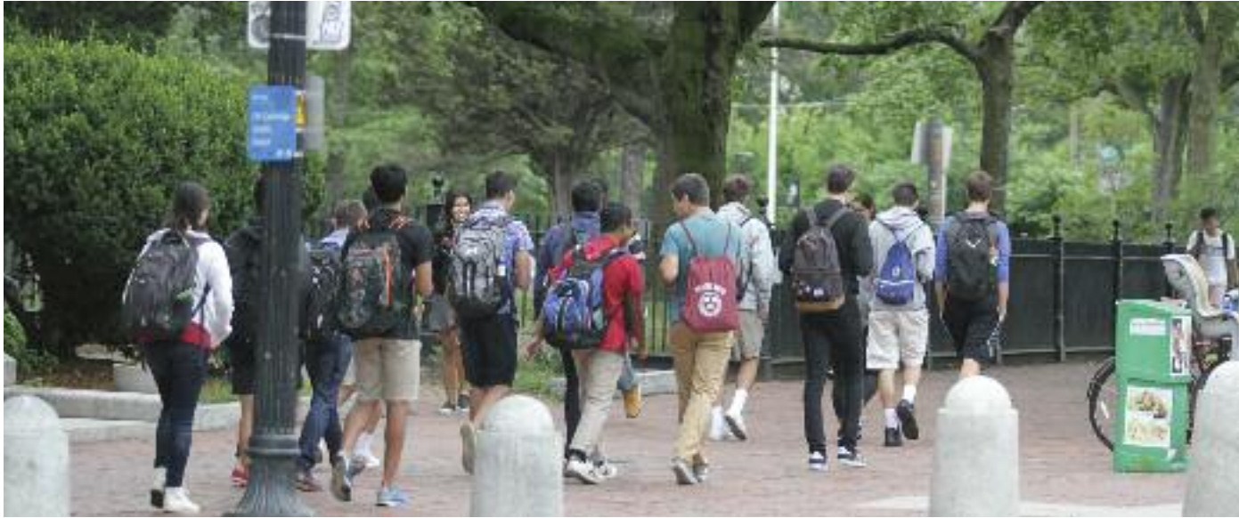
매사추세츠 학생들 중에서 한인 학생들을 만나기 쉽지 않게 됐다. 팬데믹으로 인해 매사추세츠 한인학생이 급격히 줄었다. 사진은 하버드 대학 투어 모습