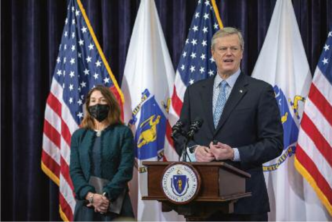
베이커 행정부는 14일 코로나바이러스 폭증과 병원 인력부족 문제를 해결하기 위해 비상 명령을 발표했다