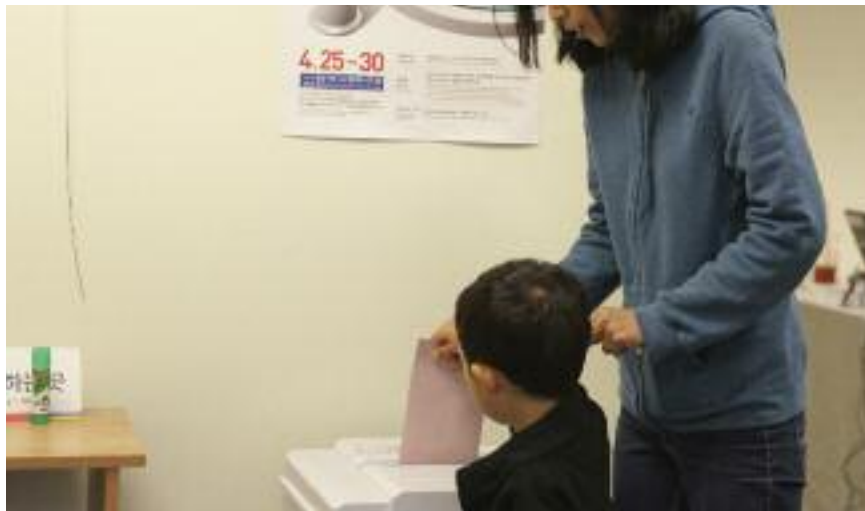
지난 19대 대선 당시 보스톤 총영사관에서 투표하고 있는 한인 모자의 모습

이번 재외선거 등록율은 세계 전반에 걸쳐 크게 위축돼 지난 19대 대선보다 6만여 명이 적게 등록했다. 보스톤의 등록율도