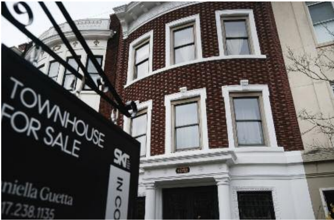
뉴욕에서 매물로 나온 주택