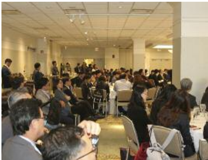
2018 한인 바이오 컨퍼런스 참가자들