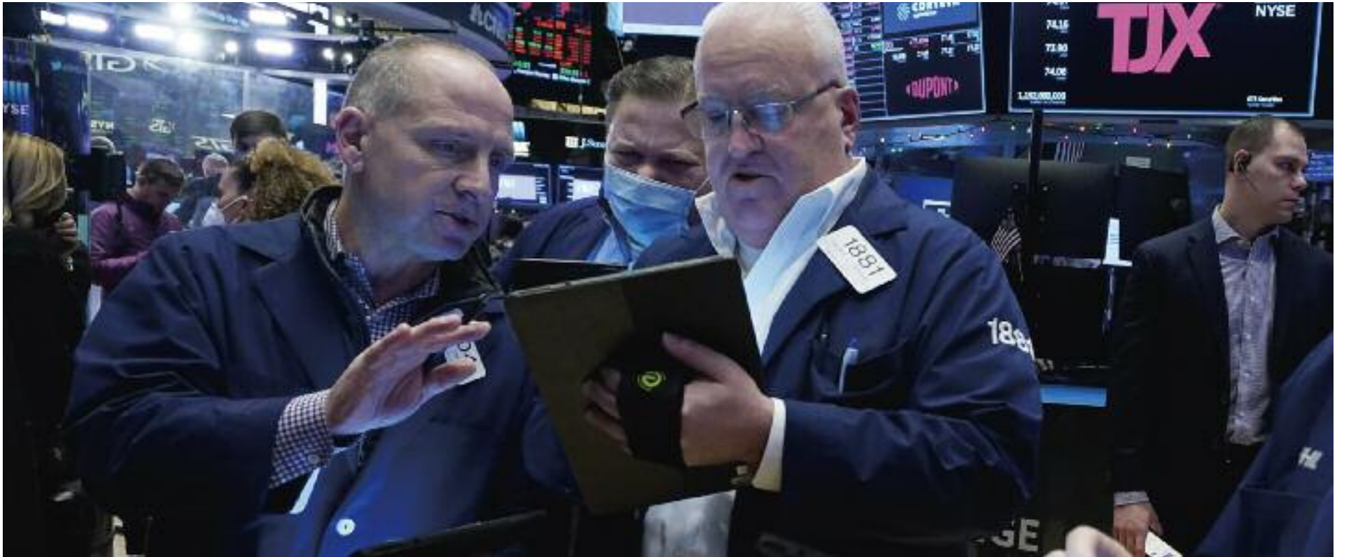
미국 증시는 19일 전고점 대비 10% 이상 하락하는 조정장에 진입했다