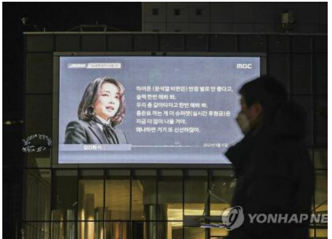
16일 오후 서울 상암동 MBC 사옥에 걸린 전광판에서 국민의힘 윤석열 대선 후보의 배우자 김건희 씨의 7시간 전화 통화 내용을 다루는 MBC 프로그램 '스트레이트'가 방영되고 있다.

가상 3자대결 조사에서는 윤 후보로 단일화하면 이 후보 38%, 윤 후보 42.1%로 오차범위 내였다. 그러나