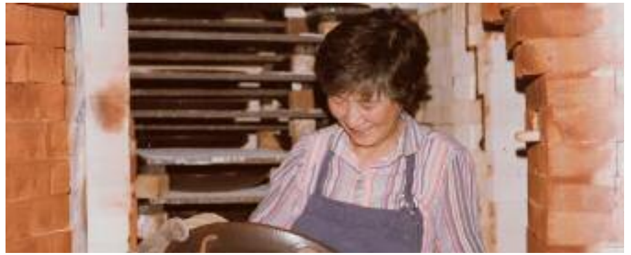
자기에 대해 강의하였다. 그녀는 하버드도 직원들에게 많은 영감을 주었다. 보스톤 한미예술협회는 지난해 6월 추모 전시회를 개최하기도 했다.