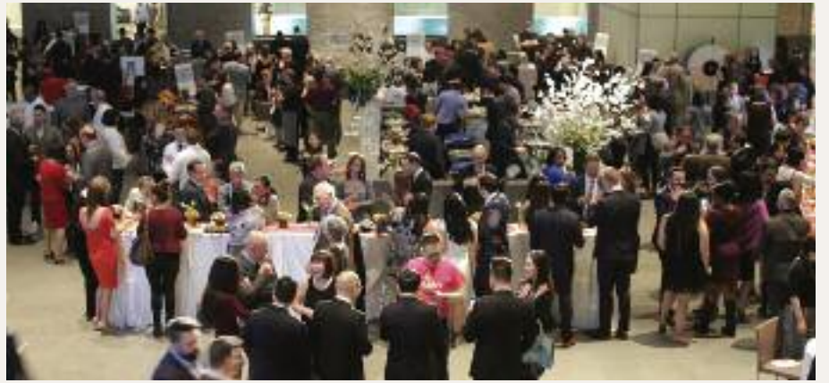
2018 조슬린당뇨센터의 '생강맛보기'행사가 9일 보스턴미술관에서 열렸다. 약 500여명의 참가해 30여 유명 셰프의 음식과 술을 즐겼다

음악도 좋다. 참가한 여러 사람들과 만나네트워킹 할 수도 있다. 많은 음식을 맛보기 위해서는 부지런히 부스를 돌아다녀야 하므로 소화에 걱정이 없다. 약 2시간이 순식간에 지났다. 여러 사람을 만나 이야기를 나눴다. 오랜만에 보는 친구들도 있어 좋았다.