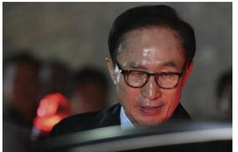
검찰에 의해 재판에 넘겨진 이명박 전 대통령 모습

측근들이 구속되자 이 전 대통령은 긴급 기자회견을 열고 검찰을 강하게 비판했다. 1월17일 이 전 대통령은 서울 삼성동 자신의 사무실에서