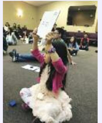
뉴햄프셔 내슈아 소재 한마음 한글학교는 한국어 골든징 대회를 4월 8일에 개최했다

(보스톤 = 보스톤코리아) 편집부 = 뉴햄프셔 내슈아 소재 한마음 한글학교는 한국어 골든징 대회를 4월 8일에 개최했다. 올해로 두번째를 맞이하는 골든징 대회는 학생들이 그동안 배웠던 한국어 실력을 부모님들에게 보여줄 수 있는 좋은 기회였다.