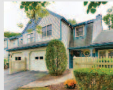
Just listed: Town House/Condo 109 Crystal Brook Way - Unit B, Marlborough, MA Asking price: $284,900 Listing Agent: Clif LaPorte