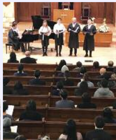
보스톤가곡예술협회는 위안부 피해자 할머니들을 주제로한 연례 콘서트의 피날레 공연을 성공적으로 마쳤다