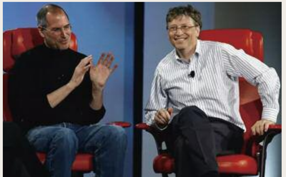
Steve Jobs와 Bill Gates

standing in the field.” 웃기게 번역하자면, “사람들 말이 내가 들판에 나가 서있으면 노벨상을 받을 거라고 해서요.” 이 농담의 펀치라인은 단어들의 이중적 의미에 있다. 즉 field는 ‘들판’이란 의미와 더불어 ‘분야’란 의미가 있고, outstanding은 ‘뛰어난’이란 뜻도 되지만 ‘밖에 서다’의 진행형이 될 수도 있다. ‘한 분야에서 뛰어난’ 사람에게 주는 노벨상을 이 사람은 ‘들판에 나가서 있는’ 사람에게 주는 것으로 착각한 것이다.