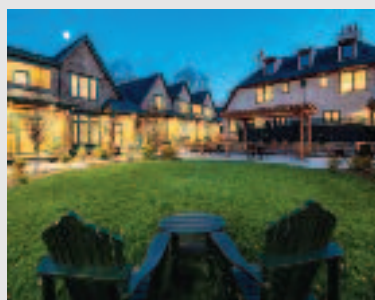
Just Listed: Single Family 16 Abbey Road - Unit 16 Sherborn, MA Asking: $1,299,000 Listing Agent: David J. Oliveri