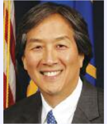
하버드 보건대학원 교수인 하워드고 교수

당뇨연구와 치료 분야에서 세계적으로 가장 규모가 크고 체계적 연구가 잘 진행되는 기관으로 알려져 있다. 최근에는 아시아인들의 경우 BMI 지수 23에서 당뇨 검사를 실시토록 하는 미 전국적인 “스크린앳2” 운동을 하버드메디컬센터 등과 함께 벌였다.