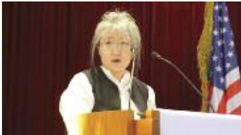
재미한국학교 뉴잉글랜드지역협의회(이하 협의회)가 주최한 2018년도 글짓기 대회가 예년에 비해 이른 시간에 끝났다