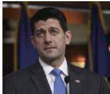
폴 라이언 미국 하원의장