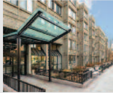
Just listed: Rental 1731 Beacon St. Unit 301 Brookline, MA Asking price: $2,100/mo Listing Agent: Vicky Xiao