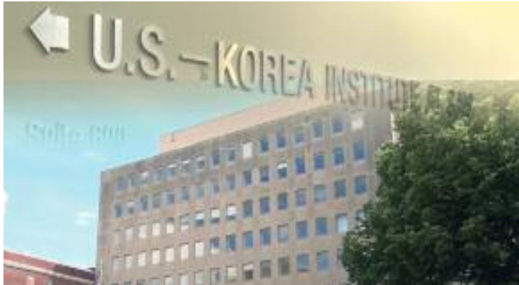
예산 지원이 중단된 존스홉킨스 대학 국제대학원 산하 한미연구소가 결국 다음달 문을 닫는다