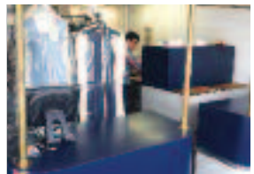
Drop shop in Newton Location! Location!