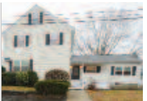
Dedham에 위치. Single Family House (7 bedr/4 bath, finished basement)