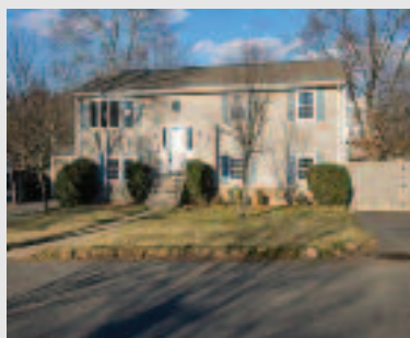
Just listed: Single Family 15 Meadow St., Dedham, MA Asking price: $599,900 Listing Agent: David J. Oliveri