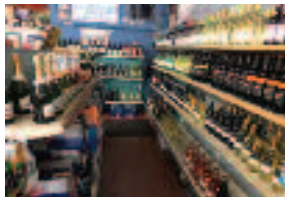
캠브리지 비어 와인 팩캐지 store