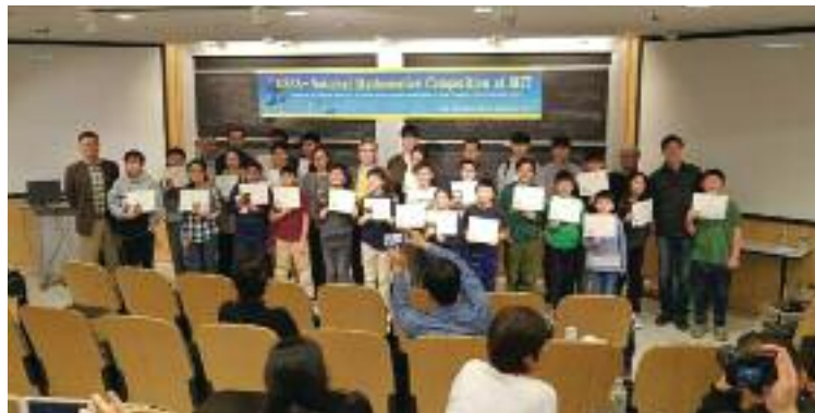
제 27회 뉴잉글랜드 과기협 주최 수학경시대회가 4월 7일 토요일 MIT에서 개최되었다. 이번 대회에는 약 50여명의 학생들이 참여해 시험에 응했다

국학교협의회 뉴잉글랜드지역협의회 글짓기 대회와 날짜와 시간이 겹친 것은 큰 요인인 것으로 보인다. 글짓기 대