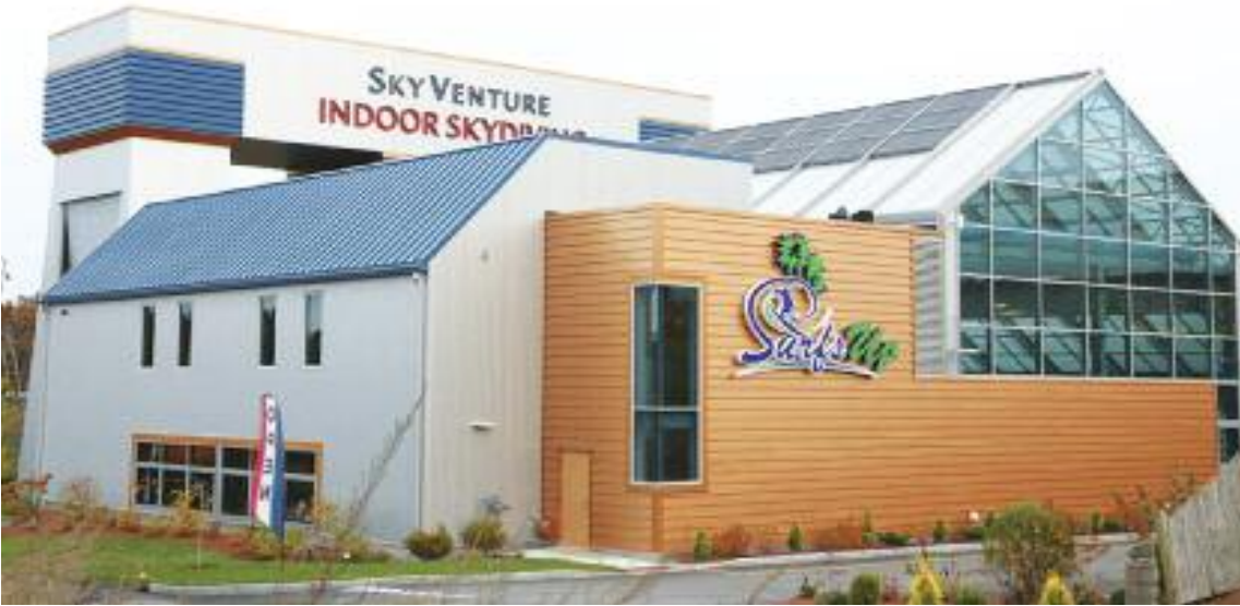
실내에서 스카이다이빙, 서핑, 슬라이드를 동시에 경험할 수 있는 뉴햄프셔 소재 (스카이벤처). 그루폰을 이용하면 좀더 저렴하게 이용이 가능하다