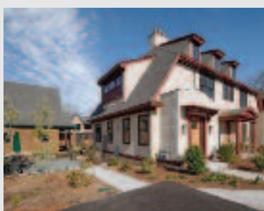
Just Listed: Rental 16 Abbey Road - Unit 17 Sherborn, MA Asking: $3,750/mo Listing Agent: David J. Oliveri