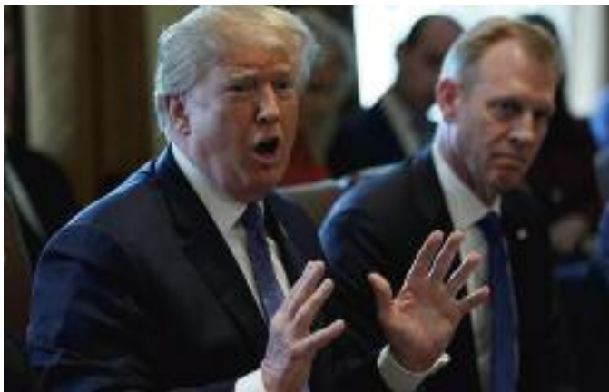
도널드 트럼프 미국 대통령

그는 그러나 이날 트럼프 대통령이 올린 "멋지고 새로우며 똑똑한 미사일이