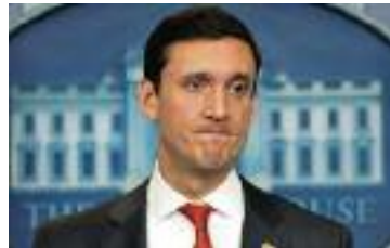
톰 보서트 미국 백악관 국토안보보좌관