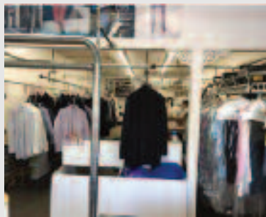
Just Listed: Business Opportunity Newton, MA 02461 Asking: $100,000 Listing Agent(s): Janice Lee