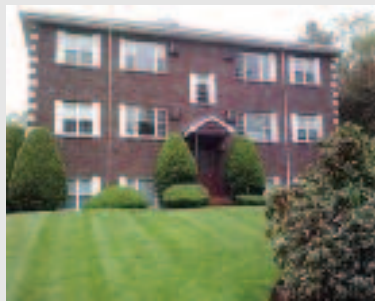
Just listed: Condominium 120 Parker St. - Unit 26 Acton, MA Asking price: $189,900 Listing Agent: Laura Rakauskas