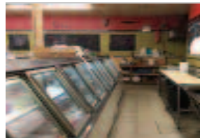
Brockton에 있는 30년된 "Meat Market" Lottery, Cigarettes, Grocery