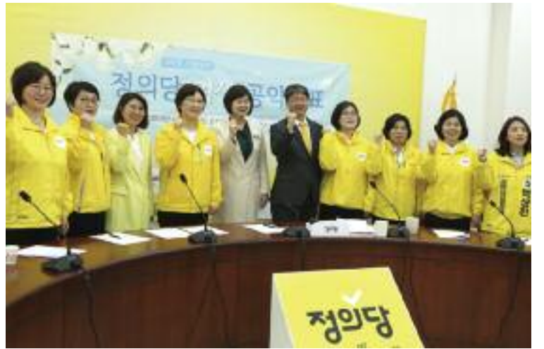
10일 국회에서 열린 정의당 기자회견

세했다. '사퇴 찬성' 의견은 서울에선 57.0%였으며 부산·경남·울산과, 대전·충청·세종도 55.7%였다.