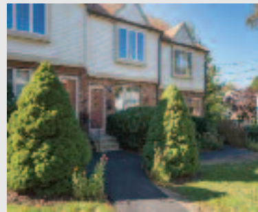
Just listed: Town House Rental 53 South Walnut St. - Unit 2 Quincy, MA Asking price: $2,300/mo Listing Agent: Vicky Xiao