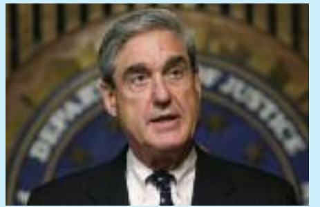
로버트 물러 특별검사

물러 특검을 보호하기 위한 이번 초당적 법안은 트럼프 대통령의 태도에 대해 의회의 우려가 고조되고 있다는 것을 보여준다고