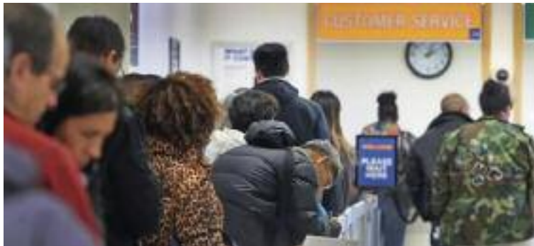
차량등록국에서 일을 처리하려면 몇 시간씩 기다려야 한다