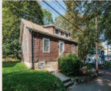
Just listed: Single family 905C Massachusetts Ave. Lexington, MA Asking price: $615,000 Listing Agent: Maria Koral