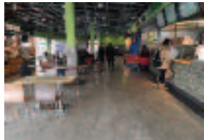
얼스톤 88 마켓 푸드 코트 안 성업중인 식당