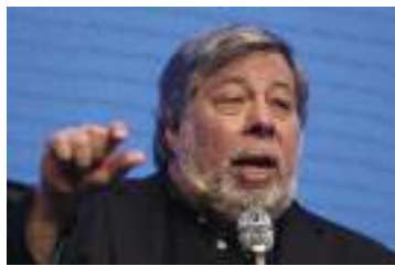
스티브 워즈니악 애플 공동창업자