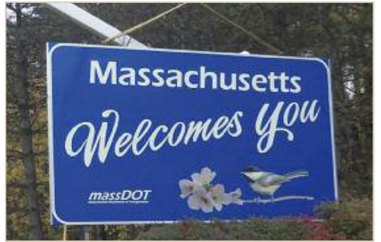
매사추세츠 주보다 덜 친절할 주는 미국 내에서 3곳 밖에 없다