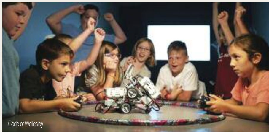
iCode of Wellesley

73 Central Street, Wellesley, MA 02482 781-291-3131