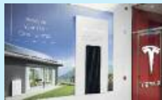
테슬라는 지붕에 설치하는 태양열 전지판을 소비자에게 판매하기 보다는 렌트하는 비즈니스를 선택했다

(보스톤=보스톤코리아) 정성일 기자 = 전기 자동차로 유명한 테슬라가 태양열 전지판 사업을 본격적으로 재개할 움직임을 보이고 있다. 테슬라는 지붕에 설치하는 태양열 전지판을 소비자에게 직접 판매하기 보다는 렌트하는 비즈니스를 선택했다.