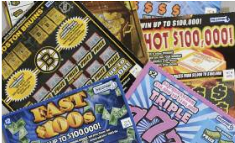
복권 사업부는 약 1만 달러에서 1만 5천 달러 상당의 복권이 부적절하게 사라진 것으로 예상하고 있다