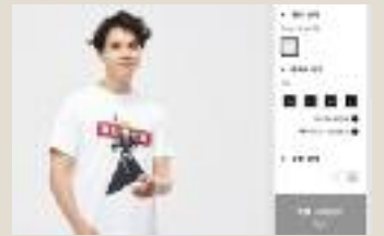
유니클로 온라인몰에서는 사진처럼 혐한 작가로 알려진 구보 다이토의 애니메이션 '블리치' 캐릭터 상품을 판매하고 있다

(서울=뉴스1) 이승환, 김연수 기자= 한국 소비자들의 불매운동 1순 위 기업 유니클로가 '혐한 논란'에 휩싸인 일본 애니메이션 작가의 '작품 캐릭터' 티셔츠를 판매하고 있어 비판을 자초하고 있다. 유니클로 불매운동이 한창인데도 '성난 여론'을 자극할 만한 제품을 판매하고 있어 논란이 예상된다.