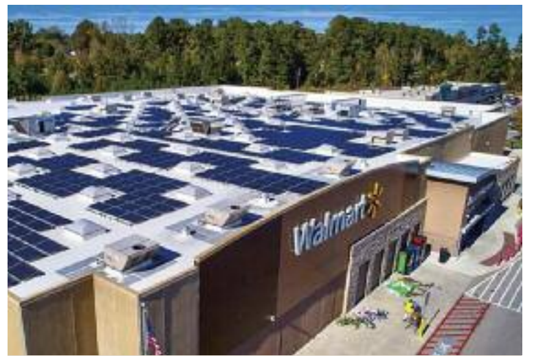
태양광 패널을 지붕에 설치한 월마트 매장

트럼프 대통령은 이날도 이를 거론하면서 "경쟁자인 삼성전자는 관세를 내지 않는 데 반해 쿡 CEO는 관세를 내는 것이 문제"라며 "애플은 위대한 미국 기업이니 단기적으로 그를 도와줘야 한다"고 강조했다. acenes@news1.kr