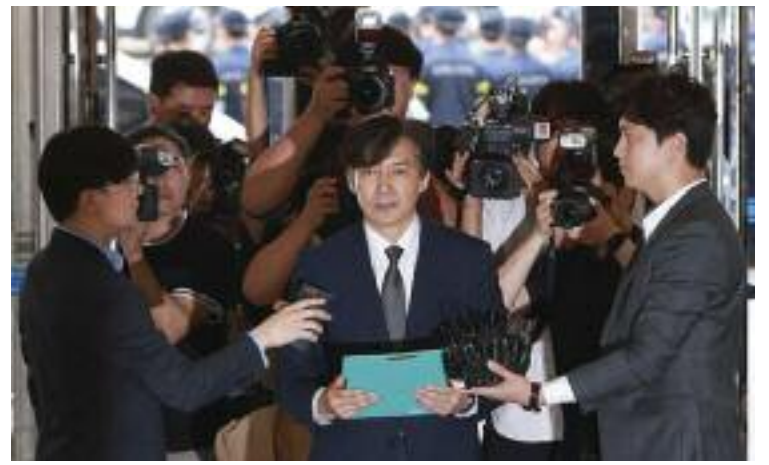
조국 법무부 장관 후보자가 22일 오전 인사청문회 준비를 위해 서울 종로구 현대대선빌딩에 마련된 사무실로 출근하며 취재진의 질문에 답하고 있다

미국 고등학교에 다니던 그는 2007년 한 영외고에 입학한 뒤 2010년 고려대 수시전형 '세계선도인재전형'으로 이과 계열에 입학했고 2015년 부산대 의전원도 수시로 입학했다. 그러나 한영외고 시절 단국대학교 의대연구소에서 2주 정도 인턴활동을 하고 영문논문 1제1저자로 이름이 오른 게 확인되면서 논란이 거세졌다. 이러한 경력 등이 고대와 의전원 수시전형에 영향을 미친 것