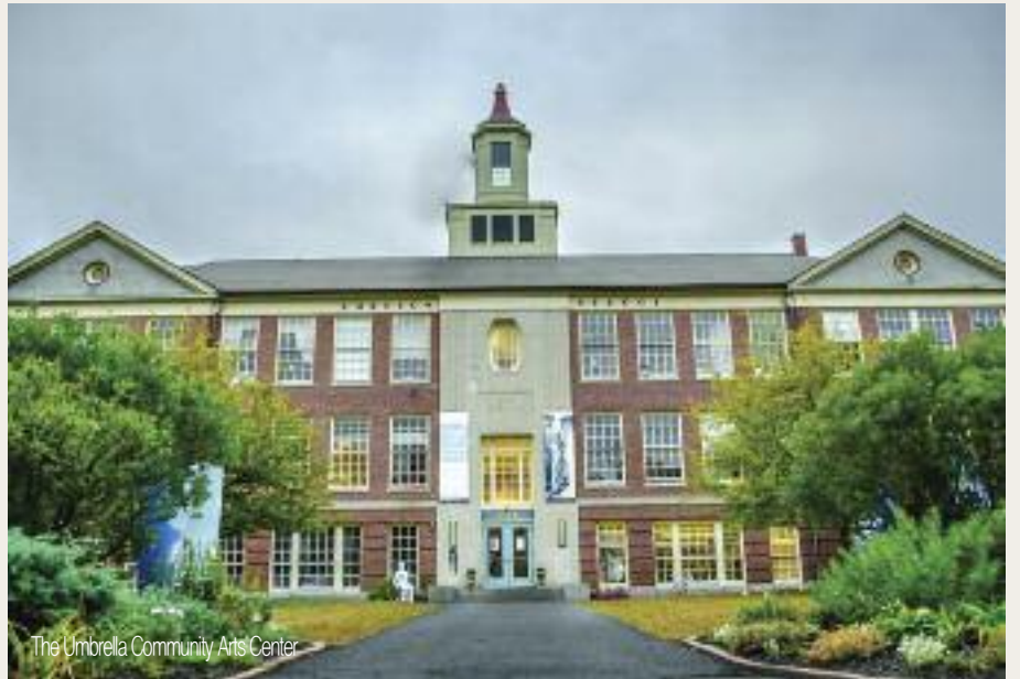
The Umbrella Community Arts Center

세계 어디에서나 함께 즐길 수 있는 스포츠인 축구를 통해 체력, 자신감, 사회성을 기른다. 1살 아이부터 시작되는 축구 수업으로 축구의 기초부터 창의적인 게임을 가르친다. 현재 수업료 10%를 할인해주는 이벤트를 진행 중이며 할인