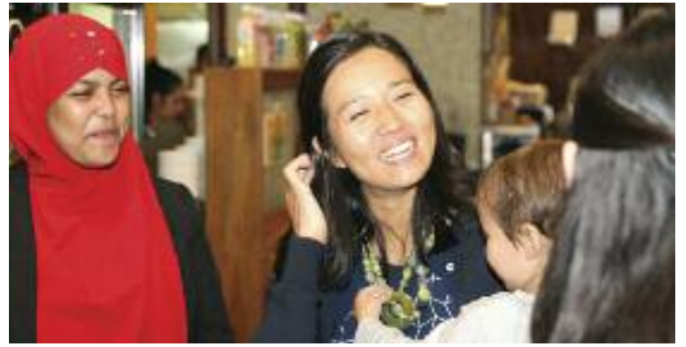
미셸 우 시의원이 펀드레이징 행사에서 보좌관들과 즐겁게 담소를 나누고 있다

보스톤 역사상 최초 아시안계 시의회의장을 2년 간 역임했으며 현재 유일한