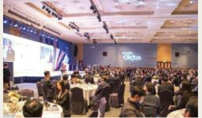
작년에 개최된 제24차 세계한인경제인대회 개회식 모습