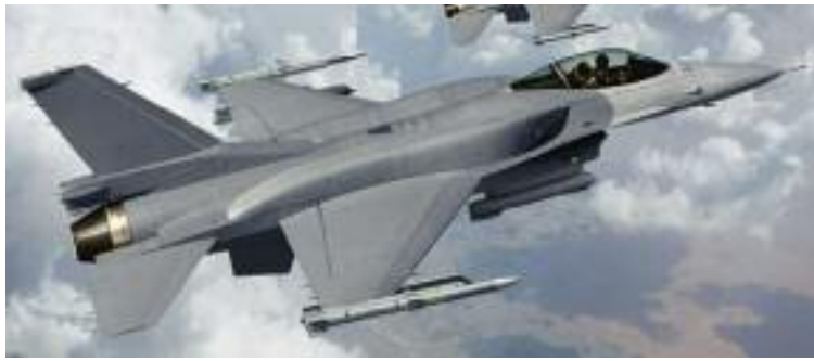
최신형 F-16V(바이퍼) 전투기

(서울=뉴스1) 한상희 기자 = 중국이 대만에 최신형 F-16V(바이퍼) 전투기를 판매한 미국 정부에 보복을 선언하고, 대만과의 무기 거래에 참여한 미국 기업에 제재를 위협하는 등 격양된 반응을 보이고 있다. 대만을 자국 영토의 일부로 간주하는 중국은 미국의 무기판매가 '하나의 중국 원칙에 위배된다'는 주장을 펼치고 있다.