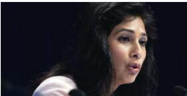
기타 고피나트 IMF 수석 이코노미스트

보고서는 "양국의 관세율이 높아진다고 해서 무역 불균형이 해소될 것 같지는 않다"며 "그 대신에 생산자와 소비자가 치러야 할 비용만 증가하고 투자를 줄게 할 것이며 전 세계적 공급망