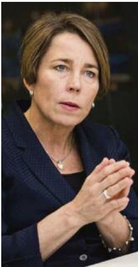
매사추세츠 모라 힐리 검찰총장은 새로운 퍼블릭차지(Public Charge) 법률을 개정된 트럼프 행정부를 상대로 8월 17일 소송을 제기했다

13개주 검찰총장 연합 퍼블릭차지 최종안 폐지 요구 시행후, 92,400 매스헬스 가입자 중 39,600명 탈퇴 위기 푸드스탬프 수혜자 10% 탈퇴 건강, 영양 안정망 위협