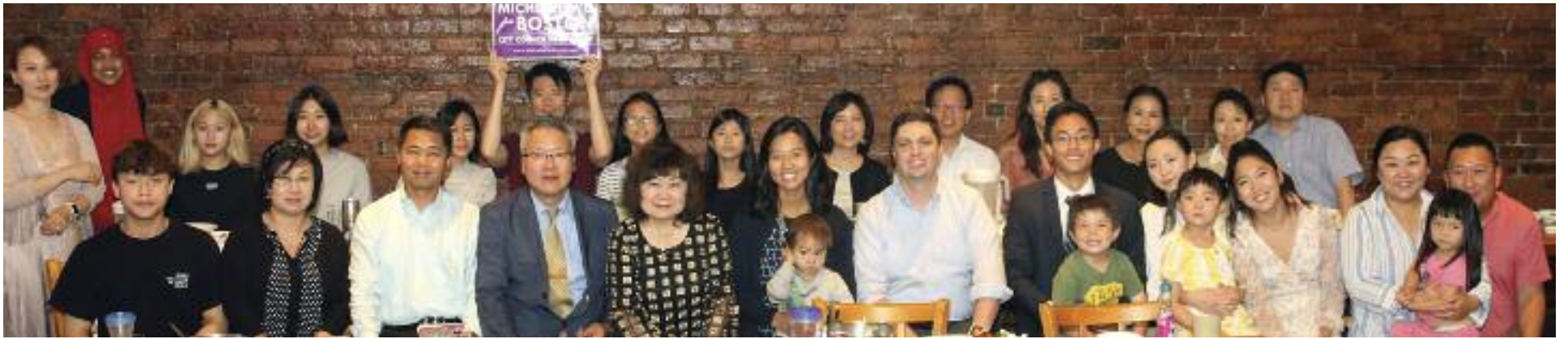
시민협회가 15일 올스톤 소재 한국가든에서 미셸 우 시의원 기금모금 만찬을 개최했다. 올해에는 예년에 비해 두배 가까운 인원이 참석했다