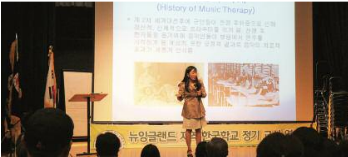
재미한국학교 NE지역협의회는 2019학년도 정기 교사연수회 행사를 오는 9월 7일(토) 오후 2시부터 개최한다