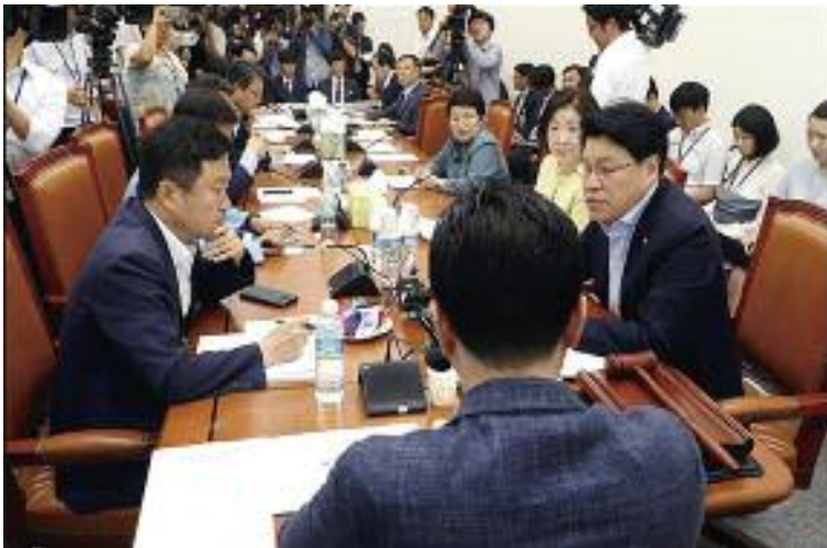
국회 정치개혁특별위원회는 22일 오전 서울 여의도 국회에서 1소위원회 회의를 열었다

심상정 정의당 의원도 "합의를 못 봤다면 전체회의로 넘겨야 한다. 소위에서 합의안을 만든다는 것은 거짓이다. 수많은 시간이 주어졌지만 못한 것은 못한 것이다. 전체회의로 안전을 넘길 것 제안한다"고 말했다.