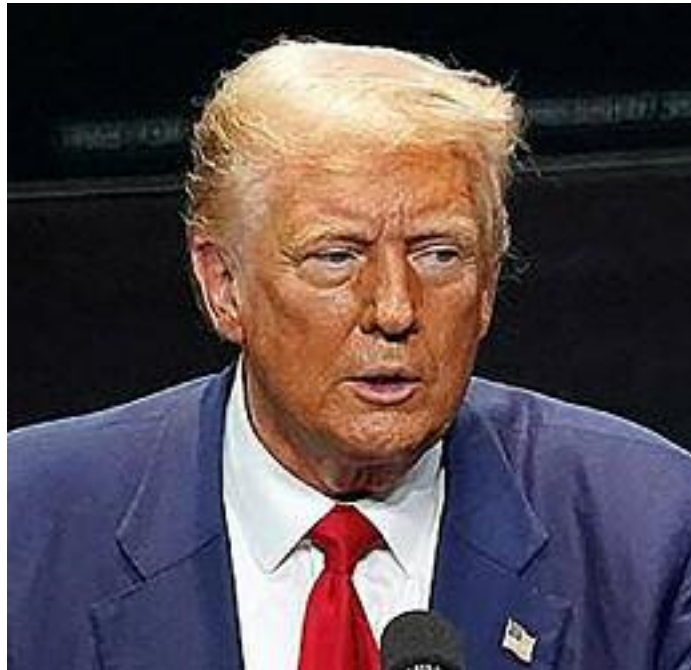
대선을 6주 정도 남겨둔 상태에서 카멀라 해리스 부통령이 아시아인 유권자들의 압도적 지지를 확보하고 있다. 한인들은 62%가 해리스 부통령을 지지했으며, 35%는 트럼프 대통령을 지지했다