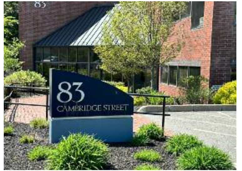
테미스 법률그룹이 위치한 83 케임브리지 스트리트 빌딩 전경