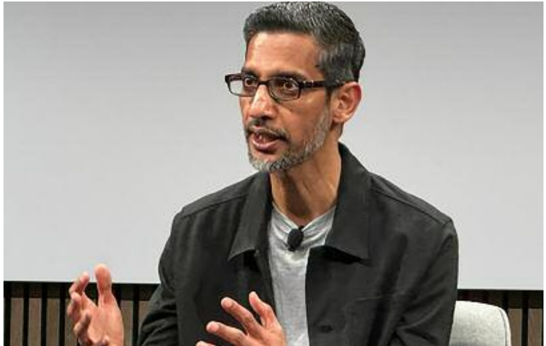
다르 피차이 구글 CEO가 15일(현지시간) 미 캘리포니아주 마운틴뷰 구글 본사에서 글로벌 미디어와 간담회를 하고 있는 모습

조했다. AI 규제에 대해서는 "각국이 규제를 논의하는 것은 당연하고 정부 입장에서는 AI가 사회에 미칠 영향을 고려할 때 이는 매우 중요한 주제"라고 언급했다. 그러면서 "AI는 경제 전반에 걸쳐 많은 기회를 창출할 수 있다"며 "이에 AI 혁신을 허용하는 것이 중요하고, 그렇지 않으면 뒤쳐질 위험"이 있다고 우려했다. 피차이 CEO는 "글로벌 프레임워크가 중요하다"며 "인터넷이 성공을 거둔 이유 중 하나는 모든 국가가 공통적인 표준에 동의하고 여기에 따라 함께 일해왔기 때문"이라고 말했다. 지난달 이스라엘에 클라우드를 제공하는 '프로젝트 님부스' 사업에 항의하던 직원들이 대거 해고된 데 대해서는 "우리는 어떤 다른 회사보다 직원들이 의사를 표시할 수 있는 다양한 방법을 제공하고 있다"면서도 "그러나 직장에 방해가 되는 방식은 옳지 않다"고 단호한 입장을 보였다. 선거를 앞두고 AI가 선거에 미치는 영향에 대해 "구글은 검색, 유튜브와 같은 제품에서 선거 무결성(elections Integrity · 공정한 선거)에 우선순위를 두고 투자를 해왔다"며 "기술이 발전하면서 딥페이크에 대한 우려가 있지만, 나아질 것이라는 희망을 갖고 있다"고 말했다.