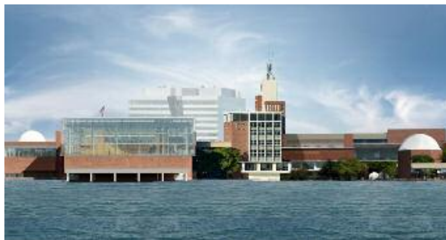
찰스강 쪽 외부에서 바라보는 퍼블릭사이언스커먼의 전경