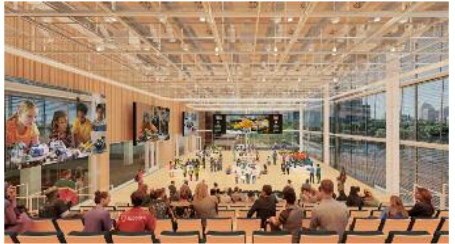
로봇 전시회를 하고 있는 퍼블릭사이언스커먼의 내부