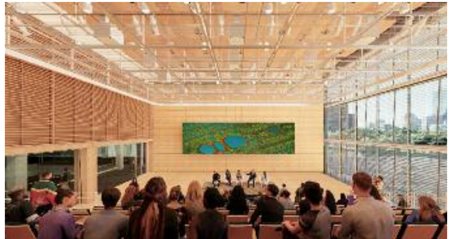
컨퍼런스를 진행하고 있는 모습