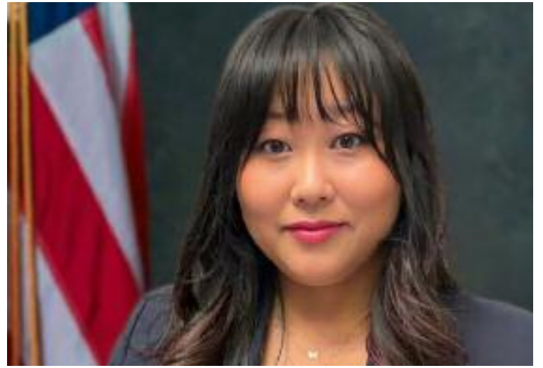
결을 위해 핵심 이해관계자들과 협력을 강화하고, 공동 해법을 마련해 온 성공적인 경력을 반영한 것이다. hsb@bostonkorea.com