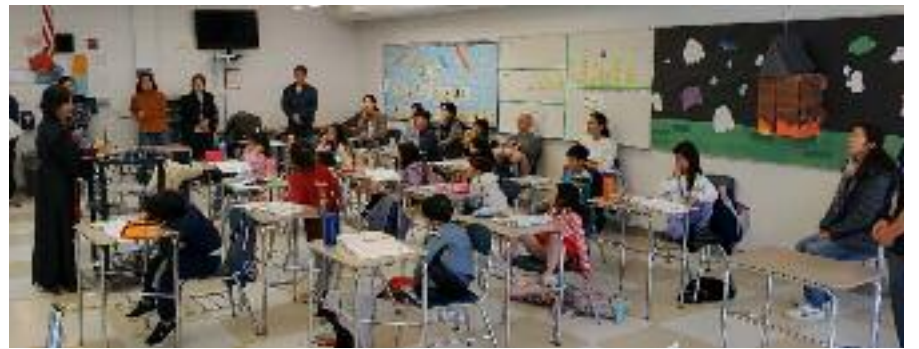
(위에서 부터) 초급과정 백제반, 거북이반, 은도끼반