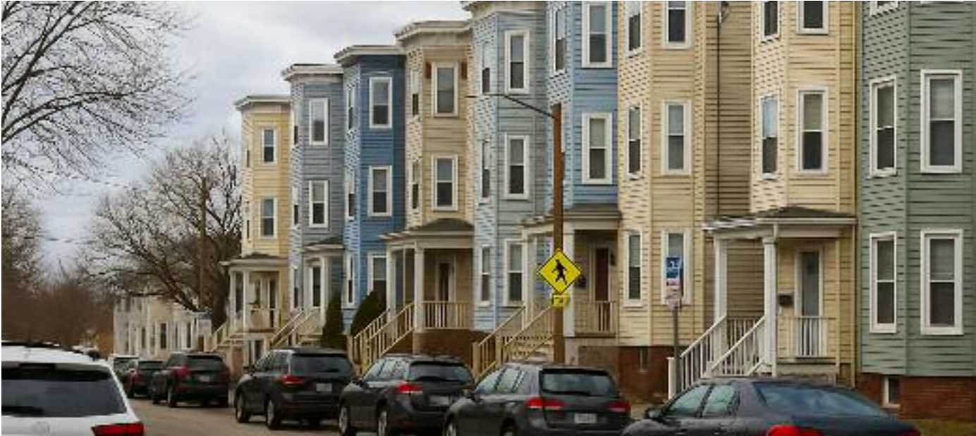
보스톤시가 지역중위소득(AMI) 100%에서 135% 소득을 올리는 중산층에게 공동 주택 소유를 위한 재정지원프로그램을 제공한다. 최대 5만달러를 무이자로 대출해 다운페이 비용으로 사용할 수 있도록 했다